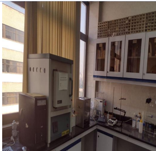
دستگاه حمام التراسونیک و دستگاه کوره الکتریکی