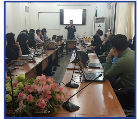
انجمن علمی - دانشجویی ژنتیک پزشکی برگزار کرد:

بنا بر گزارش مذکور، دبیران و اعضای انجمن های علمی - دانشجویی دانشگاه حضور فعال و موثری در اتحادیه های علمی - دانشجویی داشته و دارند به نحوی که دبیر دو اتحادیه از بیست و دو اتحادیه انجمن های علمی - دانشجویی کشور از دبیران انجمن های علمی دانشگاه بوده و در شورای مرکزی سایر اتحادیه ها نیز دبیران و اعضای انجمن های علمی - دانشجویی دانشگاه نقش مؤثری دارند. این گزارش افزوده است: این موارد مختصری از وضعیت فعلی انجمن های علمی - دانشجویی دانشگاه می باشد که منجر به کسب نتایج قابل قبول در نهمین جشنواره ملی حرکت در کرمان شد. کسب عنوان دانشگاه قابل تقدیر در بخش موفقیت های چشم گیر انجمن های علمی، کسب عنوان برگزیده در بخش نشریه از سوی انجمن علمی - دانشجویی باستان شناسی، کسب عنوان برگزیده در بخش خلاق از سوی انجمن علمی - دانشجویی مدیریت فناوری اطلاعات، کسب عنوان شایسته تقدیر در بخش کتاب از سوی انجمن علمی - دانشجویی مطالعات زنان، کسب عنوان شایسته تشویق در بخش آموزش از سوی انجمن علمی - دانشجویی مهندسی برق و کامپیوتر و کسب عنوان شایسته تشویق در بخش نشریه از سوی انجمن علمی - دانشجویی زبان و ادبیات عربی از جمله موفقیت های انجمن های علمی - دانشجویی دانشگاه در نهمین جشنواره ملی حرکت می باشد. گفتنی است شورای دبیران انجمن های علمی - دانشجویی در این نامه درخواست هایی را در راستای تسهیل فعالیت های انجمن های علمی - دانشجویی بیان کرده است.